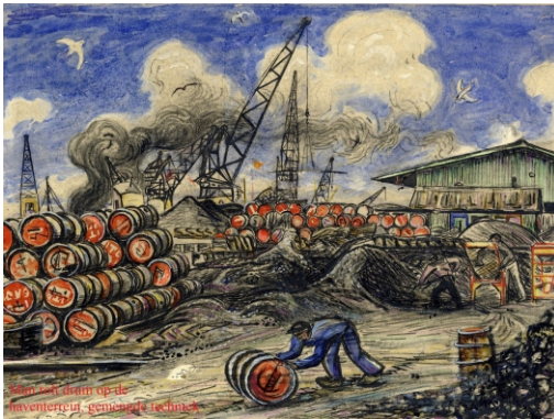
Van het dunn op de inventieve, genuege techniek