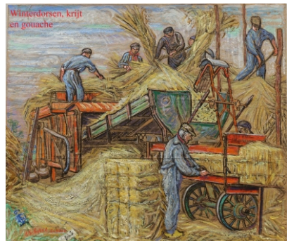
Winterdorsen, krijt en gouache