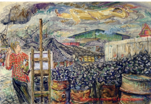
Arbeiden meten de kruit- en vanden