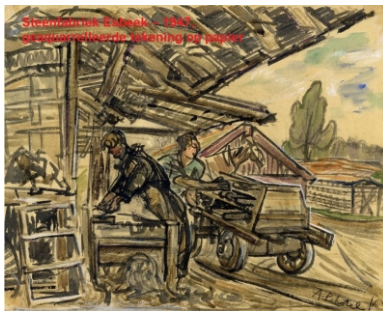
Steenfabriek Esbeek - 1947 Steenwerkzaamheden aan de fabriek