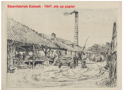
Steenfabriek Esbeek - 1947, ets op papier