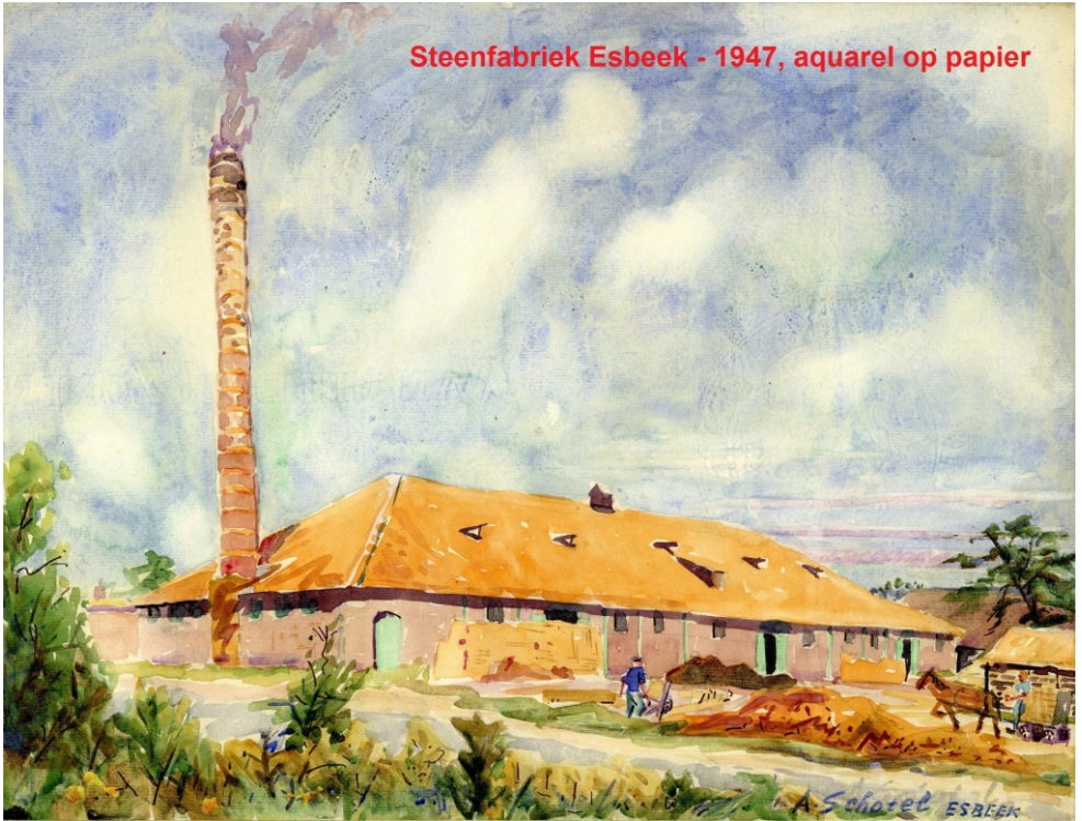
Steenfabriek Esbeek - 1947, aquareel op papier