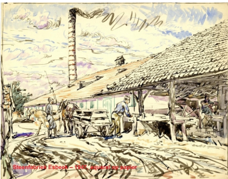
Steenfabriek Esbeek - 1947, aquareel op papier