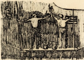
Scheepsschilders – ca 1935, verniss mou op papier