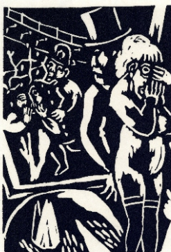
Aad de Haas, Langs de kruisweg VIII