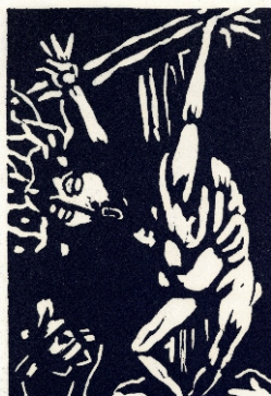
Aad de Haas, Christus sterft