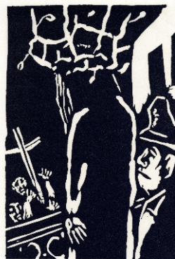
Aad de Haas, Zie de mens