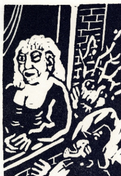
Aad de Haas, Langs de kruisweg I