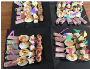
met foute drankjes en foute hapjes.