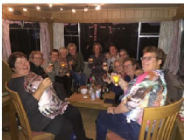
Het was een zeer geslaagde party

We zaten met z'n allen in de caravan op 't Hoogeind.