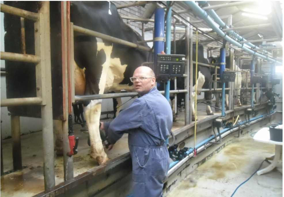
Koeien melken op de boerderij

Muziekkeuze: “Ik heb een vriendin in Oekraïne, vandaar dat Russische muziek mij aanspreekt. Toch valt mijn keuze op de leuke muziek van WC Experience.”