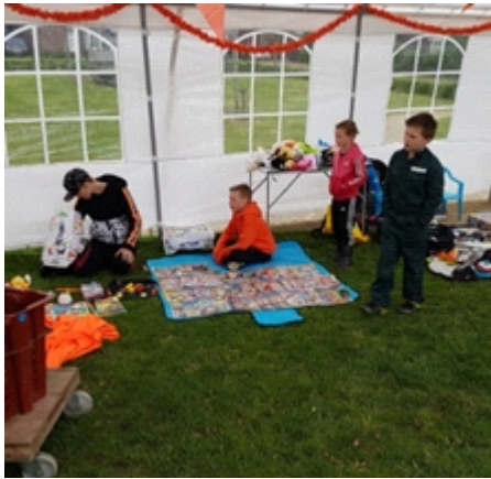
Foto 's Koningsdag 2019