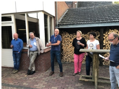
Foto 's Opening Flaeskamer Schuttershof