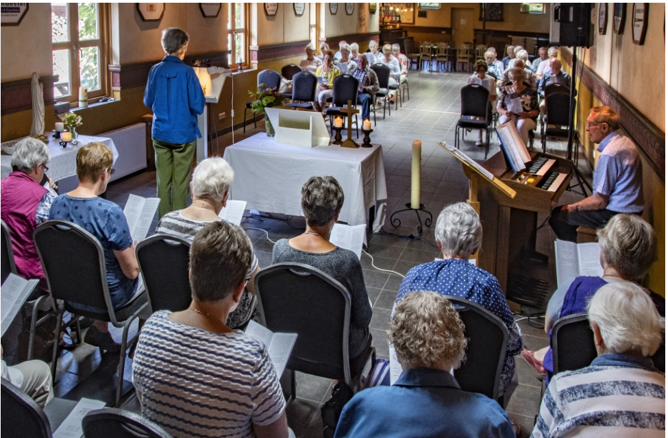
De Adrianus geloofsgemeenschap Esbeek.