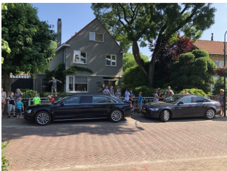
Foto 's bezoek Koning Willem-Alexander aan Esbeek