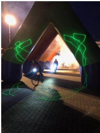
Foto 's Lichtjesticht MTB-Esbeek 2018