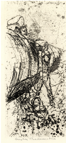
Vier personen bij gasbuis