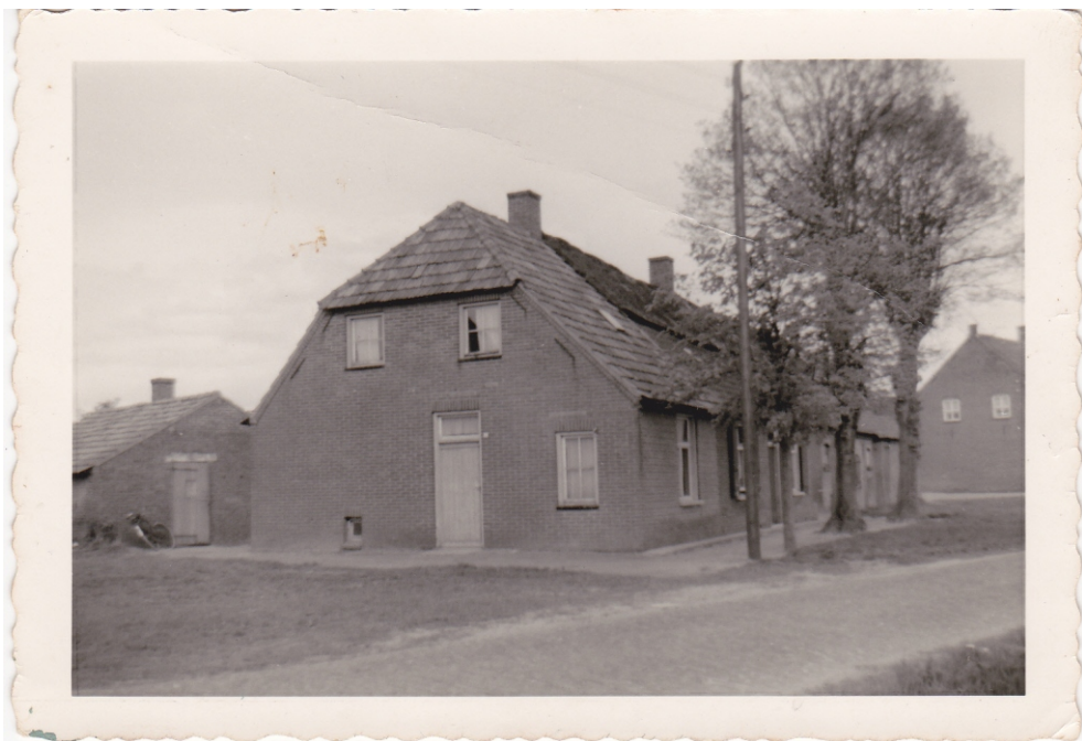
Oude boerderij van de familie Van de Wouw

“Wij zijn absoluut nergens in te kort gekomen. Ik geloof best dat het in de beginjaren sappelen voor ons pa en ma was. Later was er meer brood te verdienen in de varkenshouderij. Eindelijk kon er een wasautomaat worden aangeschaft. Onze moeder is altijd een bescheiden, liefdevolle, zorgzame vrouw geweest. Het leven van haar bestond vooral uit hard werken en zorgen. Als ik door de hoge sneeuw naar de kerk moest om misdienaar te zijn bracht ze mij weg.”