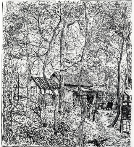
Andreas Schotel - De Schuttel 1971, etspapier