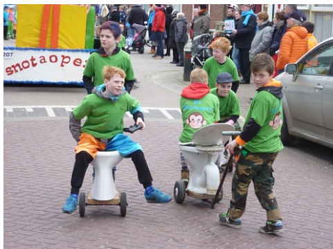
Foto 's Carnavals kinderoptocht