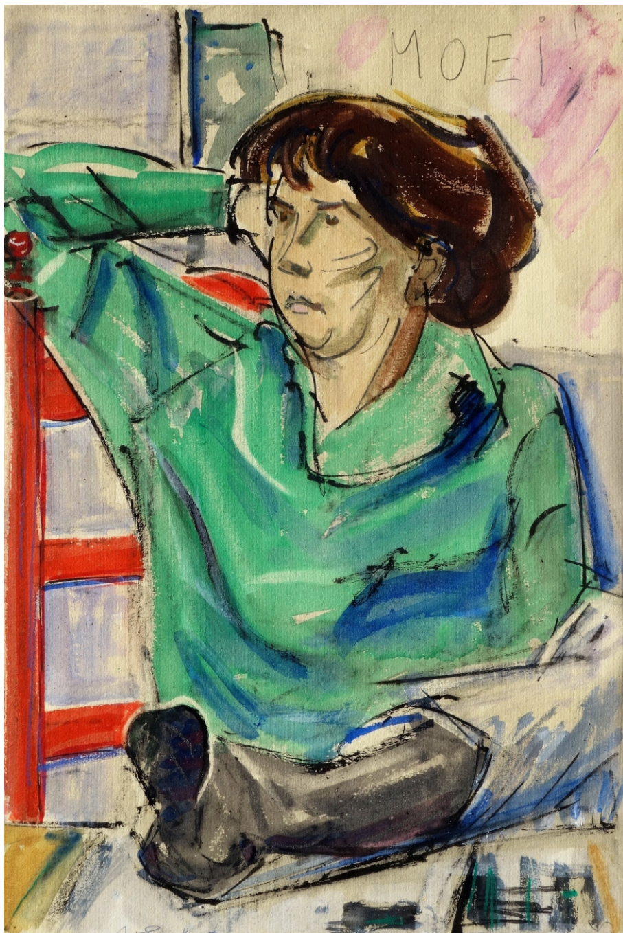
Andreas Schotel - Zittende 'moeie' vrouw, collectie Esbeek inv.nr 127 - 18