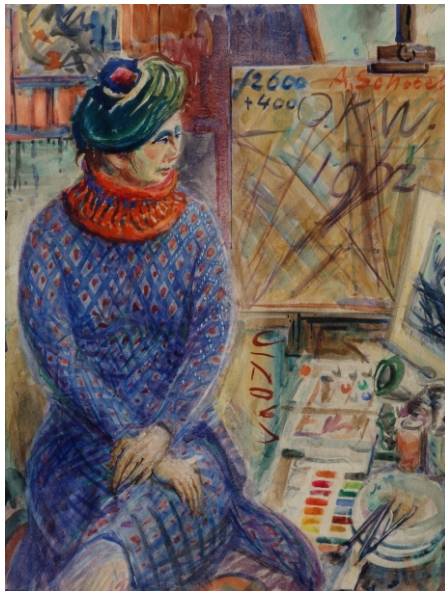
Andreas Schotel - Vrouw met baret voor schildersezels - 1962, collectie Esbeek inv.nr 127 - 15