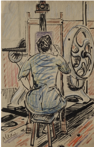
Andreas Schotel - Vrouw achter de schildersezels en voor de etspers, collectie Esbeek inv.nr 139 - 2