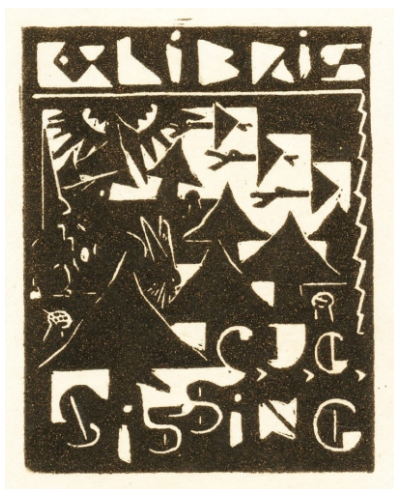
Exlibris C.J.G. Sissing[h] lino/papier 75 x 57 mm ongemerkt, collectie Esbeek, inv.nr 81/26