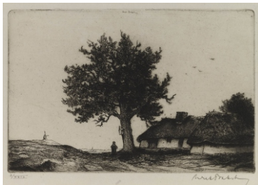
De linde uit Album De Oude Kempen 1951, ets