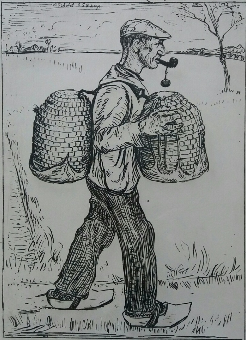
DE DORPSIMKER KEES FABRI