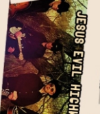
JESUS EYLL HICHMAY