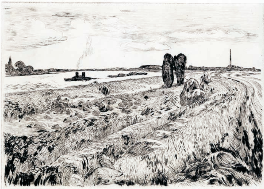
LA JOLLA, CALIF. 1892