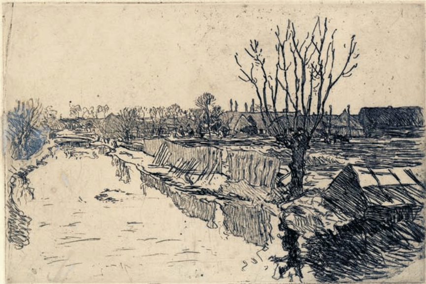
LA JOLLA, CALIF. 1892