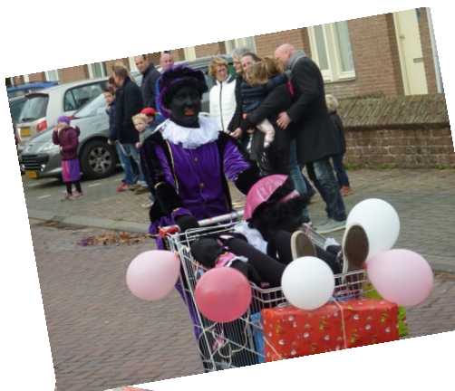
Foto 's Intocht Sint Nicolaas