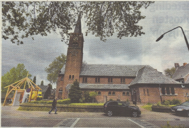
• Een houten bouwwerk voor de Esbeekse kerk duidt op de nieuwe bestemming als Samenwisaaccommodatie, basisonderwijs en kinderopvang.