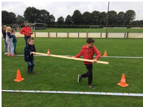
Foto 's Jeugd Vakantie Werk 2015