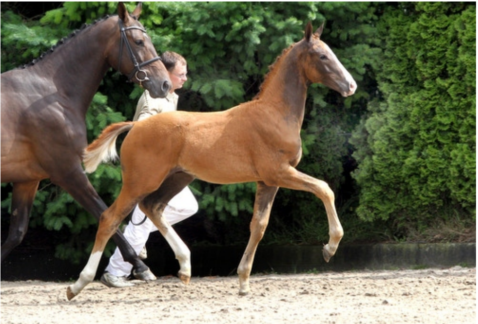
2012: Moeder Cleopatra Utopia met veulen Hummer Utopia dat op een veulenveiling in Borculo is verkocht. Momenteel loopt bij Cleopatra een nieuw veulentje aan haar voet