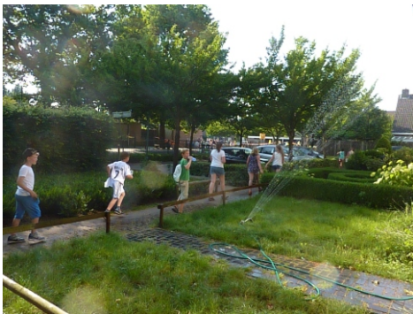
Foto 's Sponsorloop BS De Wingerd