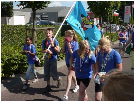
Foto 's Intocht 4 daagse Hilvarenbeek