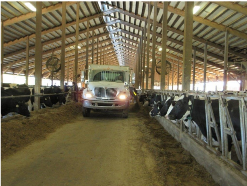
Op de grote bedrijven worden de koeien gevoerd met behulp van een vrachtwagen