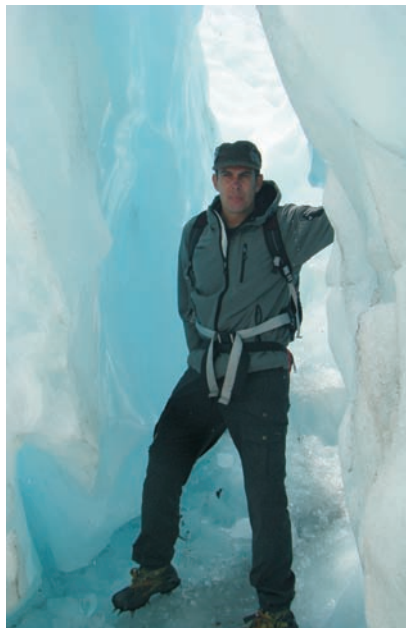
Op de Franz Jozefgletsjer in Nieuw Zeeland

Verzoeknummer: “Laat ik maar toepasselijk iets van The Police kiezen; 'Every little thing she does is magic'.”