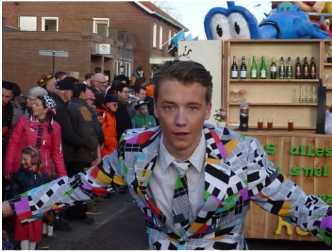
Foto 's Optocht Carnaval 2015