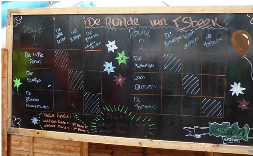
Foto 's Ronde van Esbeek 2014 Jeugd