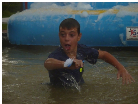
Foto 's Ronde van Esbeek 2014 Jeugd