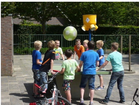
Foto 's Straatspeeldag 2014