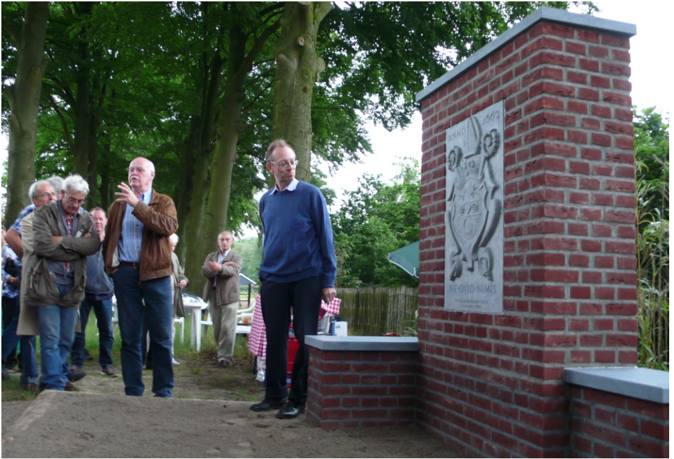
Onthulling Tuldermuurtje in juli 2013 door de archivaris van Averbode

aardkar met beslag blekstokken, beitels, zaag scherpzaag, boor, schroef zaag, petter, deszel