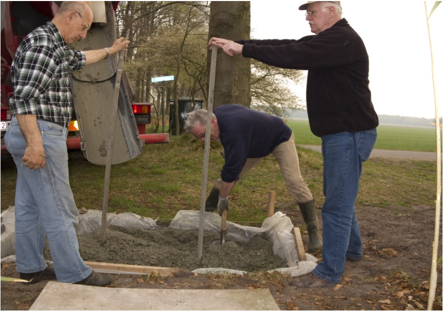
In maart 2013 werd het fundament gelegd voor het Tuldermonument

In 1625 stierf bijna iedereen op Tulder: de Tulderse Ossenaar, de knecht Doofs Diercxsonne en de meid Maecken Geerlinck crepeerden en bezweken aan de besmettelijke ziekte. Het toenmalige recept tegen de pest had blijkbaar niet geholpen: neempt een haesnoot, daer een gat in is, ende doet die vol quicksilver met groen oft root wasch toe. Dit kleinood moest men dan in een doexken oft cusken genajjt aan de hals hangen.