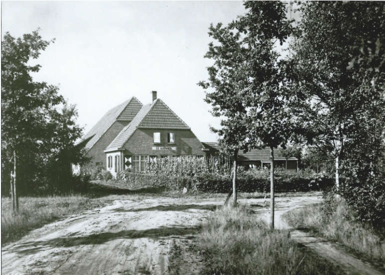
Hoeve 'De Koekoek' werd gebouwd op het voormalige 'Klein Tulder'