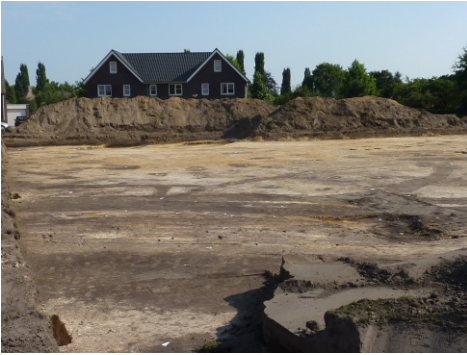
Foto 's Archeologische Opgraving Leeuwerik 3