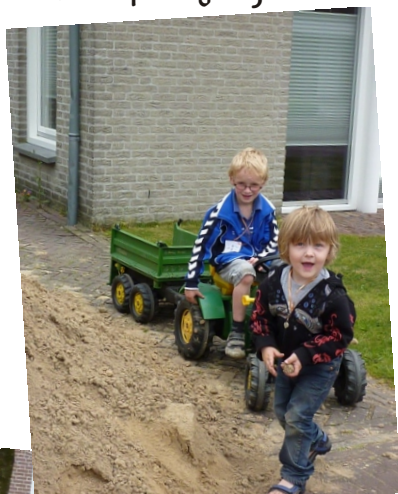
Foto 's Straatspeeldag 2013