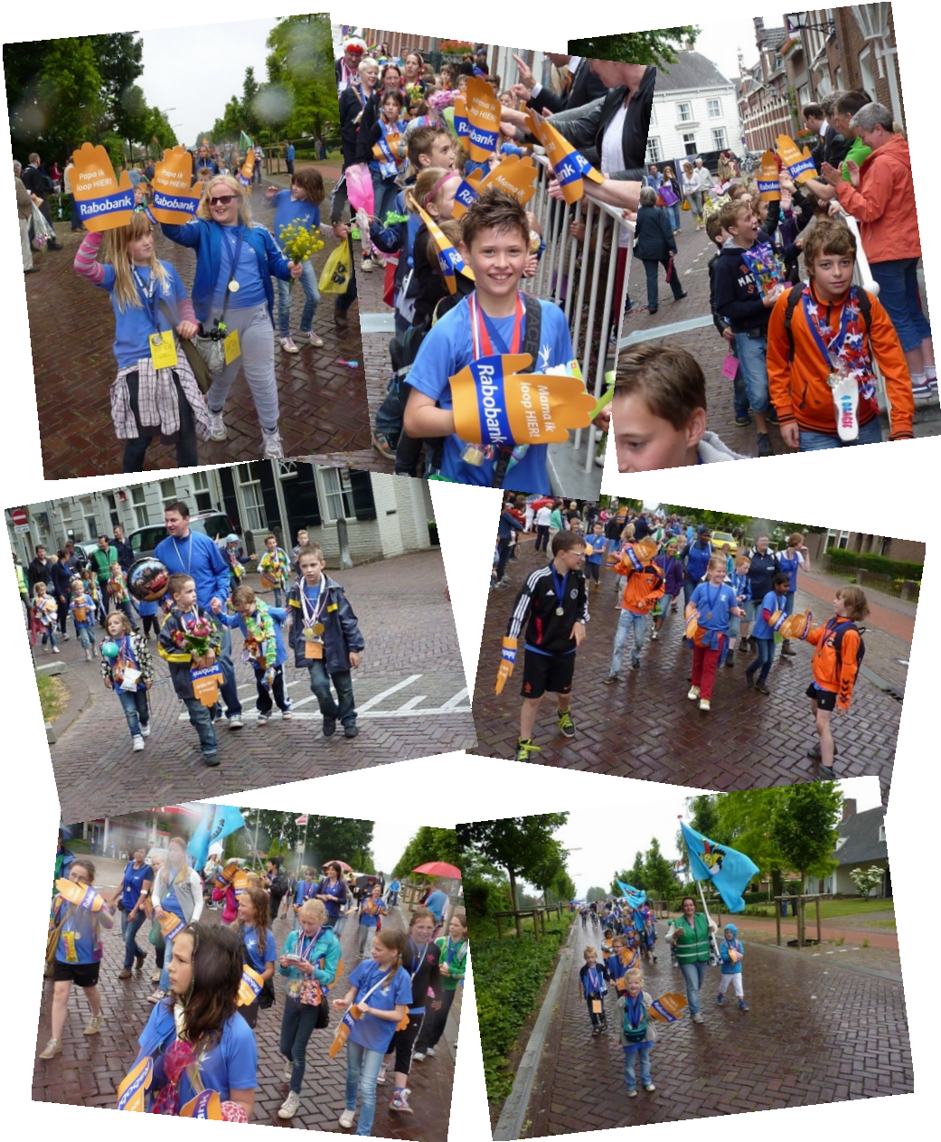
Foto 's Wandel-4-daagse 2013

Voor meer foto's wandel-4-daagse 2013, zie onze WEBSITE: www.kleppermenneke.nl menu Extra.