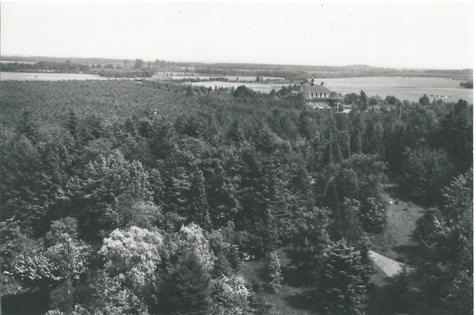
Gezicht vanuit de brandtoren met Rustoord op de achtergrond

Interessant is ook de lijst met namen van de personen welke geholpen hebben bij het brandblusschen nabij het landgoed Thulden op zondag 9 September 1928.