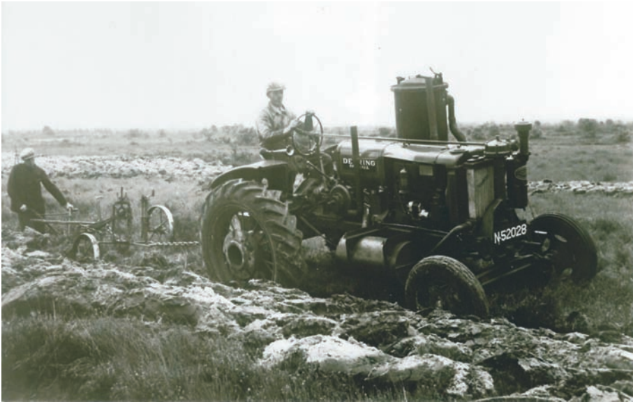
Tot 1900 bezat Esbeek nog enorm veel woeste gronden