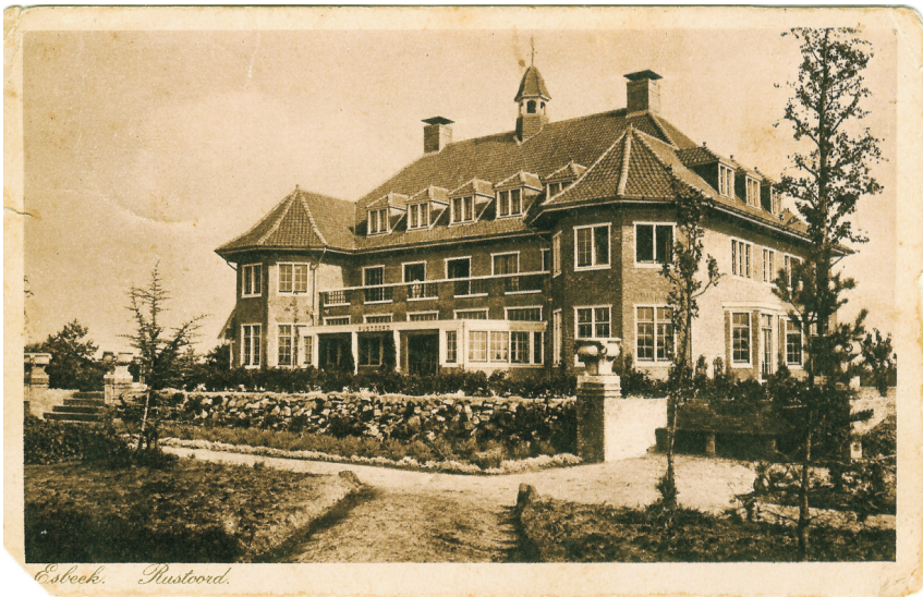
Ansichtkaart verstuurd vanuit Esbeek in 1926 (Fien van de Biggelaar)

De zitkamer bevatte niet minder dan tien kunstwerken met een totale waarde van 6400 gulden. De kunstenaars waren Floris Vester, Dupont, Daalhoff, Kropp en Isaac Israels. Verder nog: tinnen schotels, koperen doofpot, tinnen schenkkannen, tinnen kroezen, bronzen dierenbeeldjes en drie Delftsche tabakspotten . In het kantoor links van de voordeur bevond zich de brandkast met onder andere de volgende inhoud: