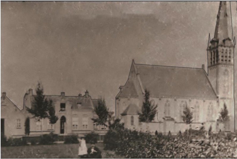
De oude kerk en pastorie in 1900 gezien vanuit de tuin en het kerkhof