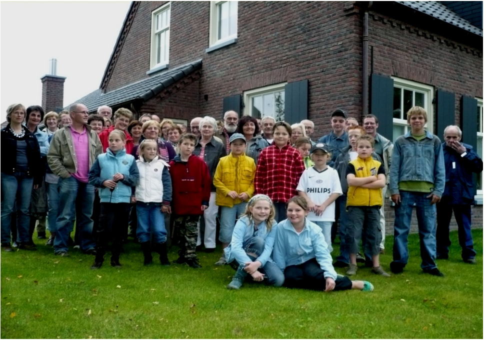
Vredig poseren de buren van de Mostaard voor de 'oude herberg'