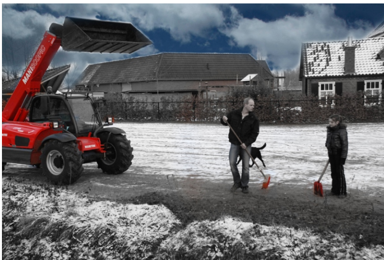
Ijsbaan in Esbeek.

De Esbeekse Lichtjestocht is ondertussen een bekend begrip geworden in de regio Hilvarenbeek. Dit evenement is uitgegroeid tot een van de grootste sport evenementen in de regio scharen. In het weekend dat de klok verzet wordt op zaterdag 24 maart zullen tussen 19:00 en 21:00 uur 1500 mountainbikers in het donker een parcours van zo'n 35km afleggen. De eerste helft daarvan voert de biker over wegen en paden rondom Esbeek en Hilvarenbeek. De laatste helft wordt ook wel funbiking genoemd. De biker komt door en langs vele ludiek verlichte objecten in Esbeek. Deelnemen kan alleen met voorinschrijving. Deze voorinschrijving zal starten op vrijdag avond 3 februari. Zorg dat je er bij bent want de 2011 editie was in 7 dagen uitverkocht!