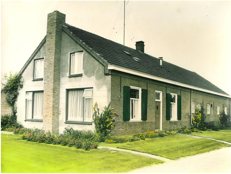
'Den Bram' werd na 1933 nog eens verbouwd en in 2011 verkocht