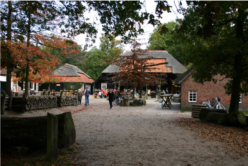
Voor een aalmoes liet de Franciscaan den Bok links liggen in 1740