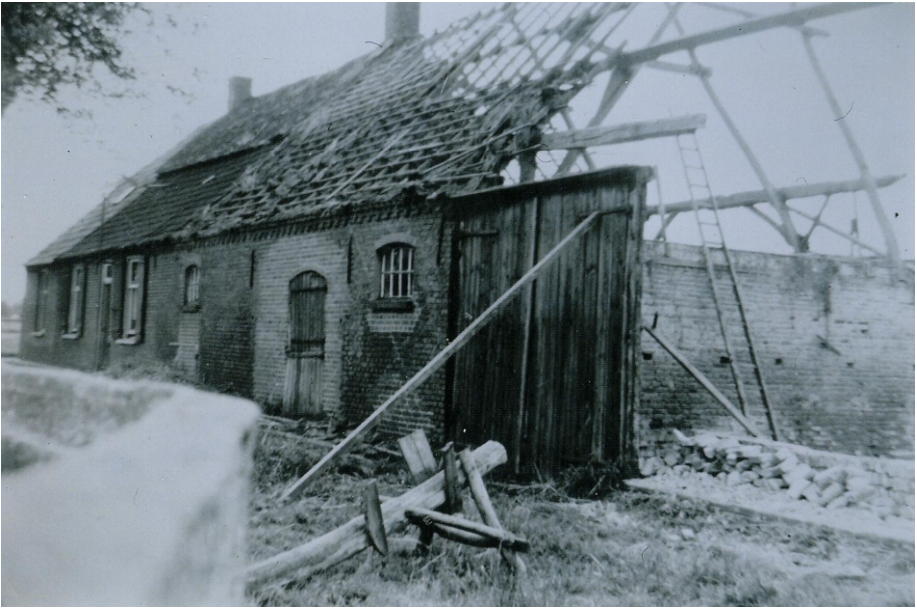
Huub van Dommelen gaat de verdwenen hoeve op de Broeksie herbouwen

Met de ruilverkaveling in 1967 is het zandweggetje met brug naar Diessen verdwenen. Toen werd ook de harde weg naar Diessen aangelegd. Daarmee verdween definitief een mooi agrarisch historisch Esbeeks monumentje.