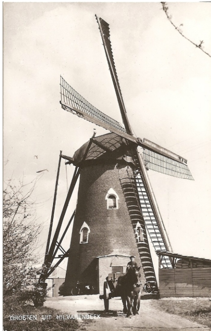
De laatste brand in de 'Esbeekse molen' dateert van 10 augustus 1961