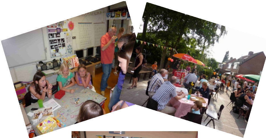
Foto 's Vlaamse Kermis Basisschool De Wingerd