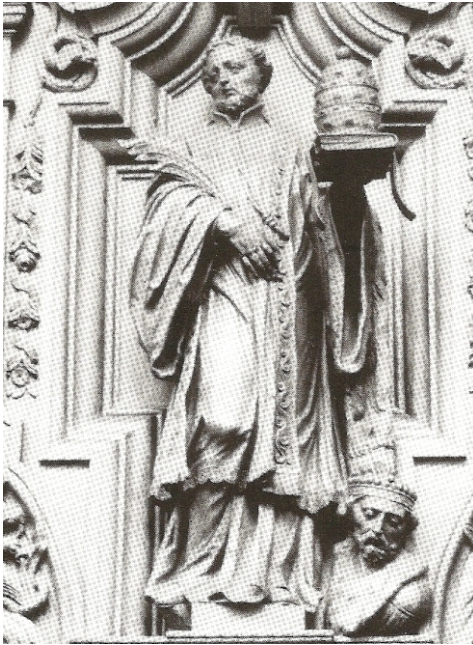
Beeld van de Esbeekse heilige in de kerk van de Abdij van Averbode in België

Er kwamen vijf martelaren uit onze directe regio: Esbeek, Heeze, Den Bosch, Poppel en Oisterwijk. In dit laatste dorp ging trouwens twee jaar later het nonnenklooster in vlammen op nadat de geuzen twee priesters hadden vermoord. Ook de pastoor van Haaren moest het ontgelden. Nadat zijn neus en zijn rechteroor waren afgesneden en zijn ogen geheel uitgestoken, werd hij koelbloedig vermoord.