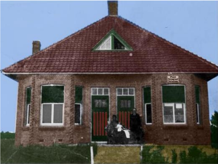
Familie Van Rijswijk runde het postkantoor tussen 1921 en 1970

De talloze postzakken die aanvankelijk door de tram en later door de B.B.A. bussen werden meegenomen, werden in dit sorteerkamertje gedropt.