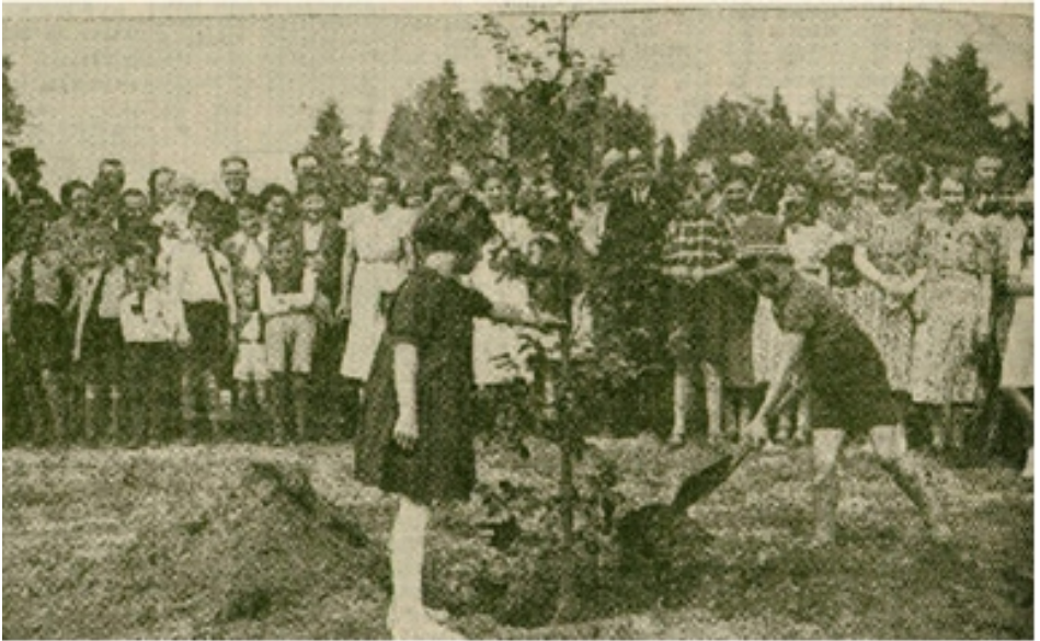
Op 8 augustus 1939 plantten Esbeekse kinderen de eerste boom in het park

Petrus Hermannus Watz (1871-1953) was in zijn tijd een zeer bekend tuinarchitect. In 1939 mocht hij het ontwerp leveren van wat later het Arboretum of Arnoldspark zou gaan heten. Pieter Watz gebruikte vaak een monumentale stijl, waarin het huis (hier kantoor met brandtoren) bijna altijd onderdeel was van de belangrijkste as. In het werk van P.H. Watz is duidelijk zijn boomkwekerij-achtergrond terug te vinden. Het verschillend aantal ceders dat hij in Esbeek liet aanplanten getuigt hier ook van. De eerste boom werd reeds op 8 augustus door kinderen geplant ter ere van Irene. Volgens het onderschrift in het Rotterdamsch Nieuwsblad zou dat gelden voor het gehele park!