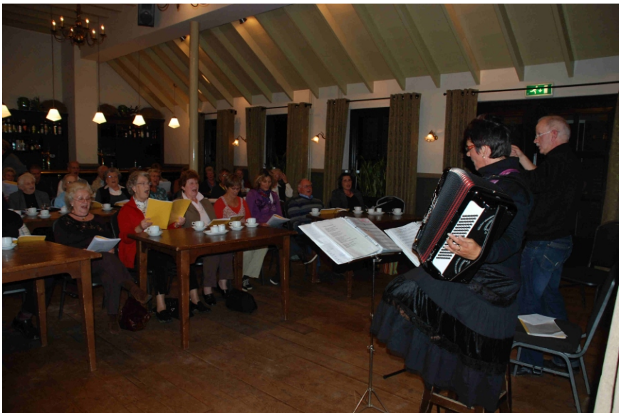
Foto eerste Liederentafel in Esbeek 5 oktober.