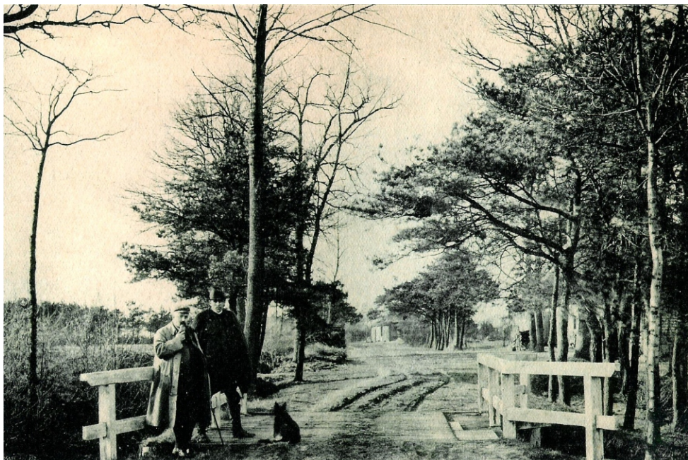
Herberg Roosen stond rechts over de brug aan de Dunsedijk komende uit Dun

Door haar ziekte en overlijden had hij veel schulden gemaakt. Daarom verzocht hij de schepenen op 13 april 1782 om een kleine erfenis, een stukje grond van 1 loopse onder Moergestel, den driehoek bij den moolen , voor 50 gulden aan zijn broer Cornelis te mogen verkopen. In feite kwam dit stukje erfrechtelijk toe aan de kinderen uit zijn eerste huwelijk: is belaaden met veele schulden veroorzaakt door siektens, sterfgevallen en andere onheilen, waardoor hij genootsaakt is geworden om sijne hoog omringende nood te stoppen.