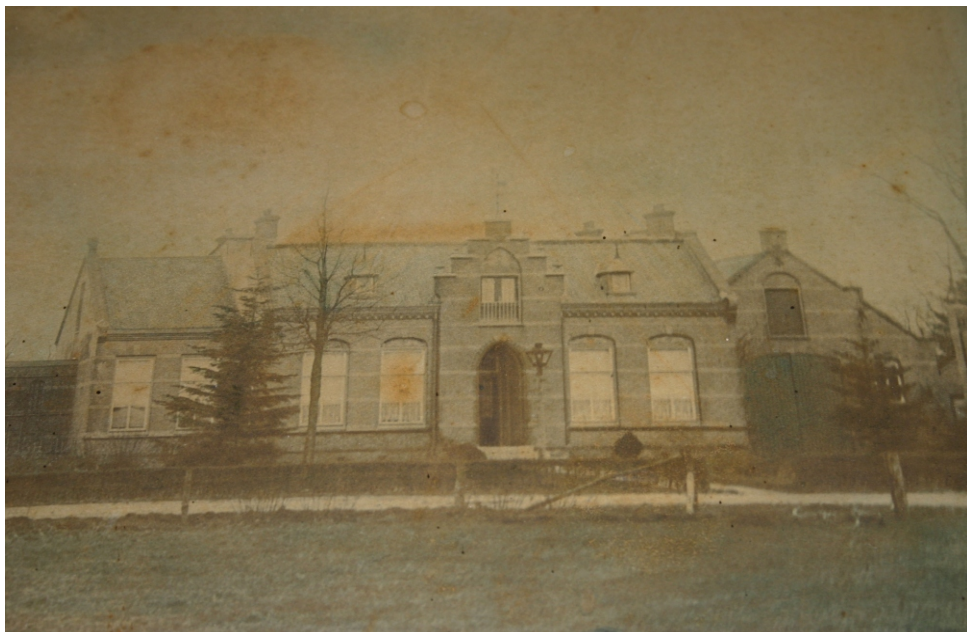
Van Dijk woonde van juni 1901 tot augustus 1903 in de oude pastorie

De voorraad goederen vertegenwoordigde een bedrag van f 4109,80 waaronder een hoeveelheid wijn van f 1650,- in de kelder. Voor openstaande rekeningen werd genoteerd: