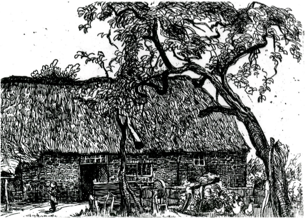
Andreas Schotel legde soortgelijk boerderijtje vast voor het nageslacht

Het schild boven de stal aan de westkant werd opnieuw gedekt, terwijl aan de noorden kant het halve dak opnieuw vervangen moest worden door nieuw stro. In de stal werd een nieuwe sult gemaakt. Dit is de zware horizontale balk waaraan de verticale palen bevestigd zijn om de beesten in de potstal te kunnen vastbinden. Ook in de latere Hollandse stal zou de 'sult' nog terugkomen.