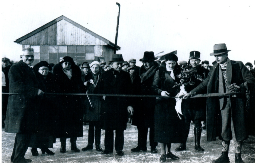
Een aantal notabelen waren aanwezig bij de opening op zondag 8 december 1933