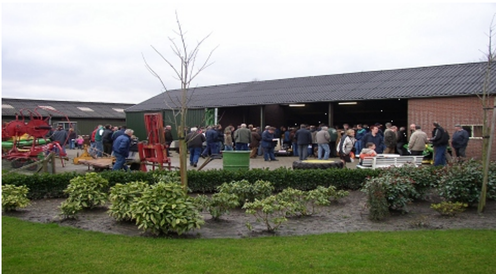
De publieke verkoop in Esbeek aan de Broeksie in 2006 verliep zeer ordentelijk